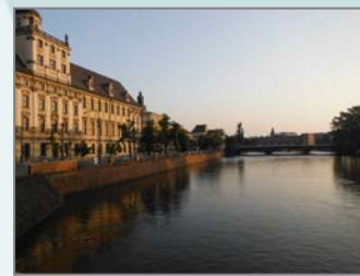
Da sinistra verso destra: la conferenza dell'8 novembre 2013 presso IRES sulle cooperazioni metropolitane, il dialogo metropolitano su qualità urbana del 25 novembre 2014, infine due vedute delle città partner di Graz e Wroclaw.