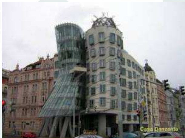
La Dancing House presso il fiume Moldava a Praga

CENTRAL EUROPE è un programma dell'Unione Europea che incoraggia la cooperazione tra i paesi dell'Unione allo scopo di migliorarne le capacità di accedere all'innovazione, promuoverne l'attrattività e la competitività, favorire il trasferimento di conoscenze e la riduzione delle disparità.