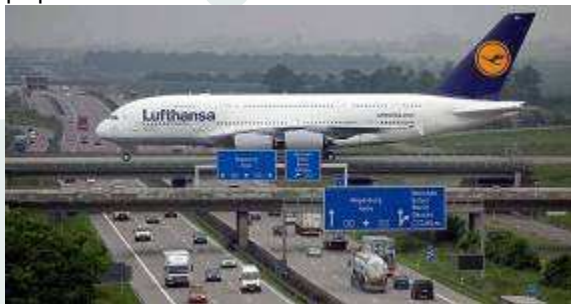
Una veduta dell'aeroporto di Lipsia

Nell'area del programma CENTRAL EUROPE circa il 70 per cento della popolazione vive in aree urbane dove si concentrano infrastrutture sociali, attività economiche, luoghi di lavoro e vita culturale. Gli enti pubblici locali e regionali in queste aree sono chiamati ad affrontare le sfide derivanti dalla necessità di coordinare strategie e visioni a scala metropolitana, per mantenere una buona qualità della vita e rispondere alle domande che provengono nell'ambito dei trasporti, degli spazi verdi, delle aree da destinare a scopi abitativi o produttivi, dei servizi da erogare alla popolazione.